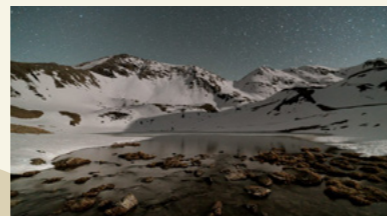
Premi Manel Dalmau a la millor fotografia. Llum de lluna de Josep Culleré Cuitart