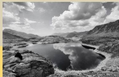
Premi categoria especial. Fotos en blanc i negre d'indrets de la Vall Fosca. El cel a l'aigua de Xavier Loan Rollan